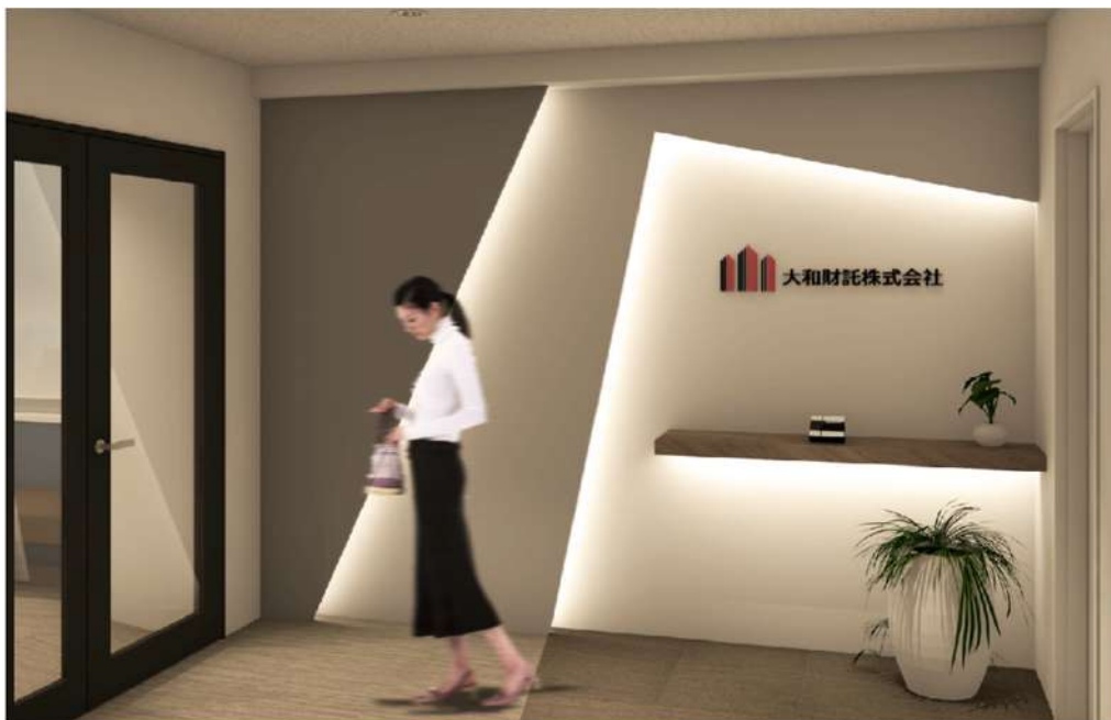
※エントランスイメージ

そして、首都圏の顧客に対し大阪本社同様の資産運用のフルサービスを提供できる体制となったこと、及び管理部門を備えたことにより、「東京支店」を「東京本社」に改称し、東京・大阪の両拠点を本社とする二本社制へと移行することとなりました。