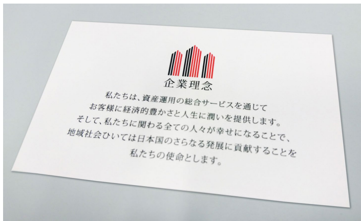
名刺の裏にも企業理念が入っているほど大切にしています